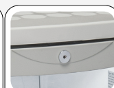
Κλειδαριά στον βασικό εξοπλισμό